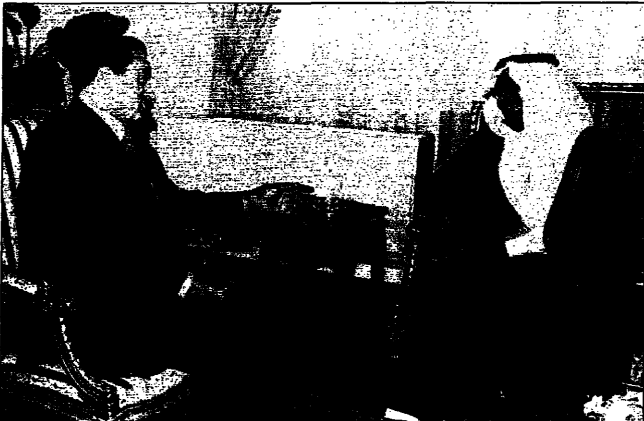
الرئيس اليمني علي عبدالله صالح مع وزير الخارجية السعودي

موروني - قال بيدنر مدير مكتب التحقيقات في موروني ان قوات من جزر القمر بقيادة قائد عسكريين من نحو 200 عسكري من جزر القمر سيخضعون من مساء الاثنين للتحقق من جزيرة انجوان التابعة للسلفوربي وبها الجيوب النازية المسلحة بقيادة مستعدين من جزيرة موروني.